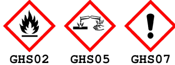
GHS02 GHS05 GHS07